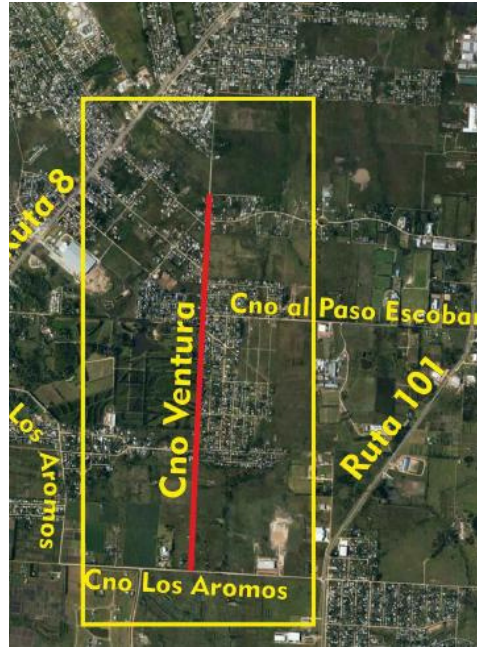
OBRA EN BARROS BLANCOS