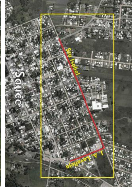
OBRA EN SAUCE