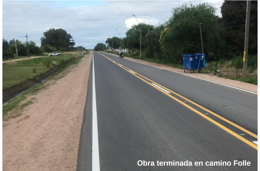
Obra terminada en camino Folle

En el marco de la obra de consolidación de San Jacinto, se colocó carpeta asfáltica en Cayetano González.