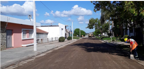
Obras en San Jacinto