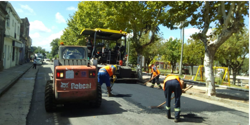
Obra de consolidación de Migues