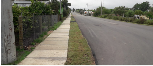
Obra de Bypass de Tala